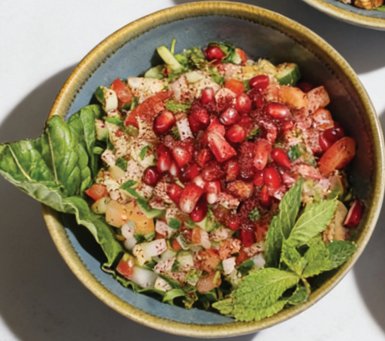
Iraqi Salad سلطة عراقية