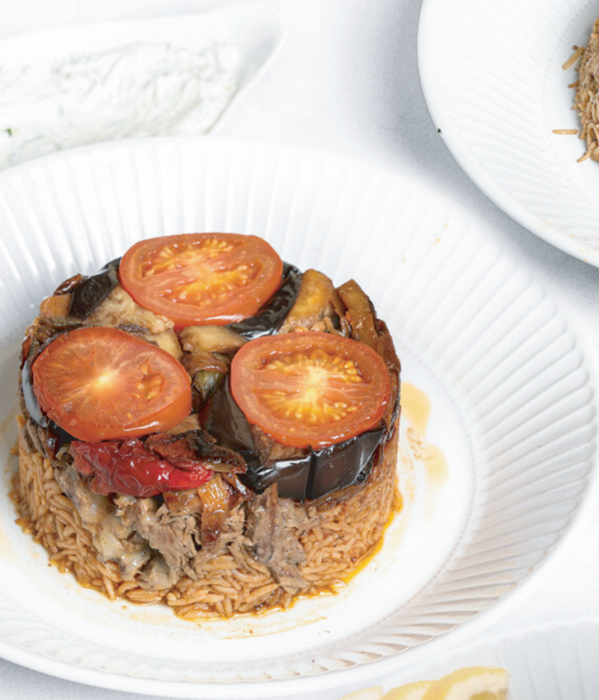
Meat Maqluba مقلوبه لحم