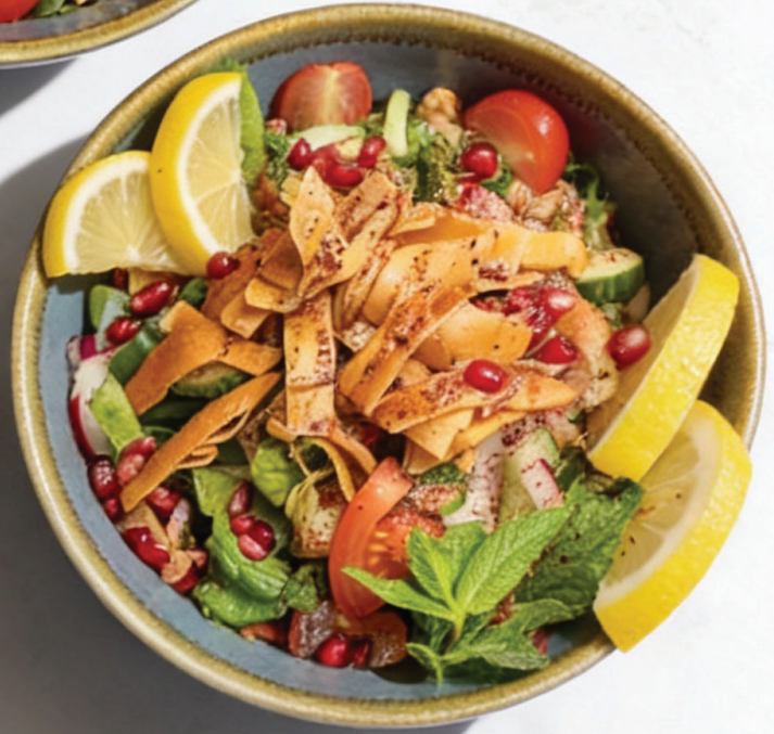
Fattoush Salad سلطه فتوش