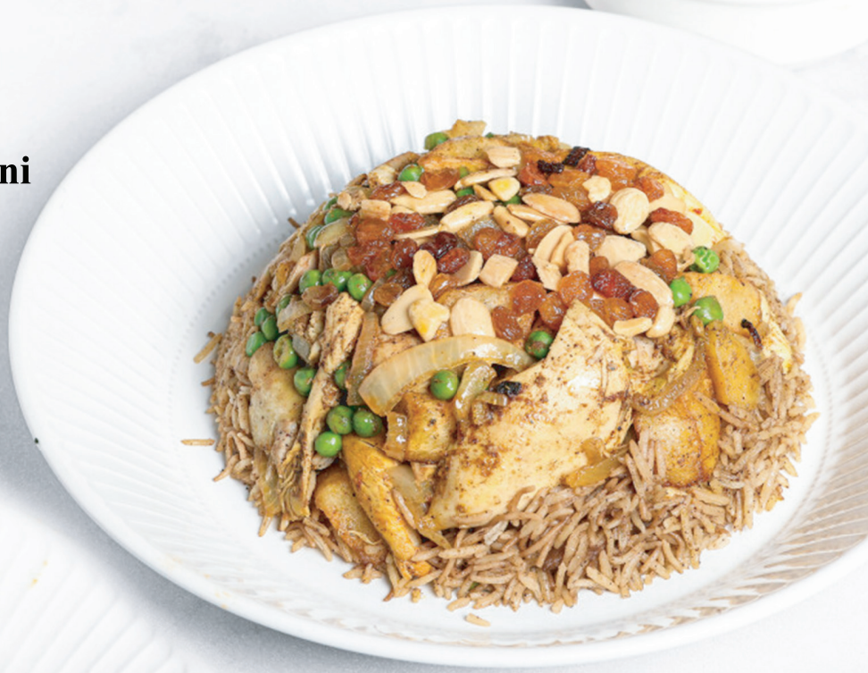
Chicken Biryani برياني دجاج